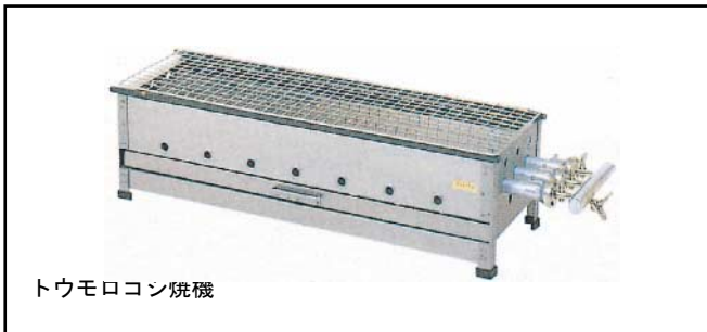
トウモロコン焼機

注意 火傷注意！ 使用中あるいは消火直後は鉄板・コック部が熱いので触れないで下さい。 重量物・指つめ注意！ 鉄板部材は重いので運搬に注意し、手足等をつめないように。